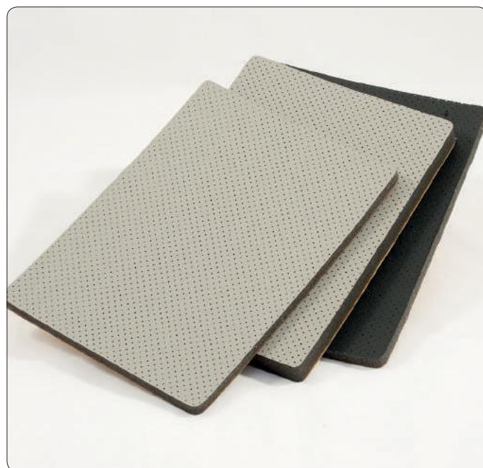
Absorptionskoefficient iht. DIN 52 215

Sugende underlag, som f.eks. ubehandlede træplader bør primes med en kontaktlim type 555.